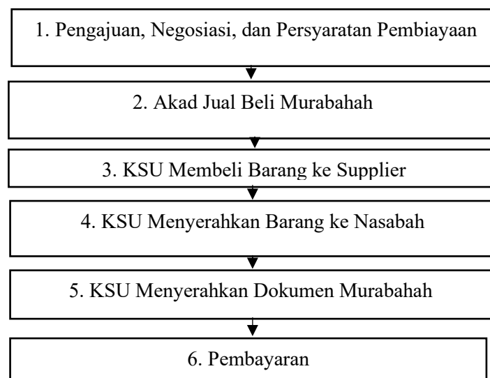
Gambar 2. Skema Murabahah pada KSU Tunas Mulia Mandiri

Berdasarkan hasil wawancara dengan pengurus KSU Tunas Mulia Mandiri, berikut ini adalah penjelasan terperinci mengenai bagaimana akad murabahah diterapkan dalam memberikan pembiayaan kepada nasabah.