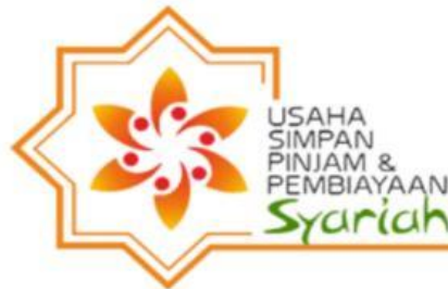
Gambar 5. Logo Uspps Kopindosat

USPPS (Unit Simpan Pinjam Syariah) karena meningkatnya kebutuhan pembiayaan dan permintaan pembiayaan yang sesuai syariah bagi karyawan Indosat.