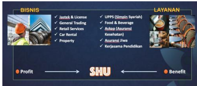
Gambar 3. Profit dan benefit Kopindo

Koperasi pegawai Indosat atau disingkat menjadi Kopin mempunyai dua kategori jenis usaha yang bersifat profit dan benefit, profit yang menghasilkan margin dan yang benefit yang menghasilkan manfaat untuk anggotanya seperti gambar dibawah ini: