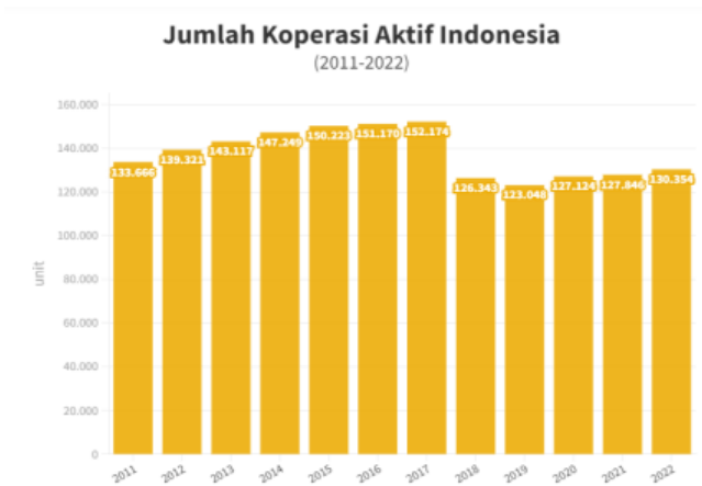
Gambar 1. Jumlah Koperasi Aktif Indonesia